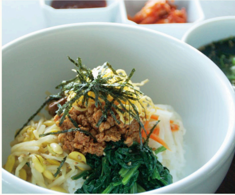
韓国料理の定番 自家製肉味噌乗せビビンバ わかめスープ付き