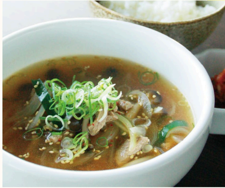
ほどよい辛味がやみつきに 辛 旨辛ユッケジャンスープ ご飯・キムチ付き