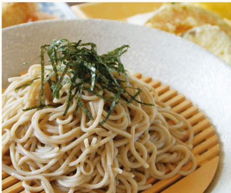
つるんとうまい定番の味 天ざる蕎麦 or うどん いなり寿司付き