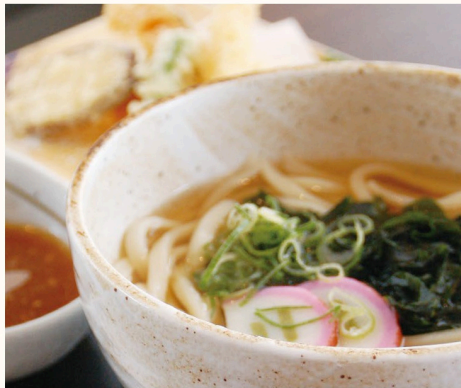
出汁香る 天ぷらうどん or 蕎麦 いなり寿司付き