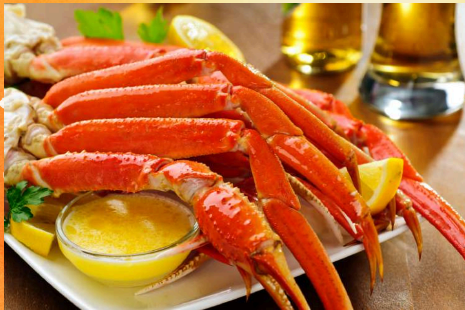
↑片山津ソサエティのご夕食は豪華蟹づくし会席