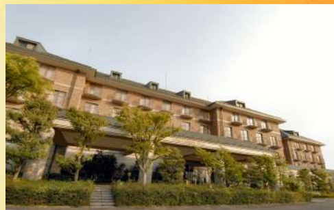
↑ダイヤモンド片山津温泉ソサエティ